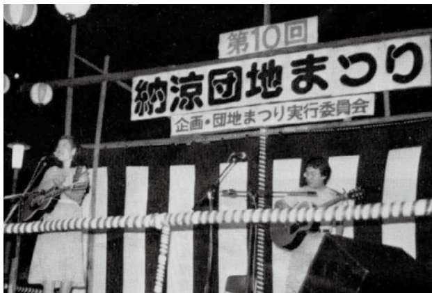
第10回納涼団地まつり・みんなの会報55号掲載 (1980年5月30日発行)

イキングで千葉県こどもの国へ 行く。 なかったものの火災の恐しさを まざまざと感じさせられる。 12月19日 住宅公団東京東営業所長 名で、共益費1カ月650円の 値上げを予告。 1月13日 ホップ・ステップ運動の 最終段階。自転車整理運動大詰 めに(自転車整理について合同 部会開く)。 3月18日 住宅・都市整備公団が昨 年来言ってきた83年度から家賃 の再値上げ方針を83年9月1日 から実施すると国に申請を行う。