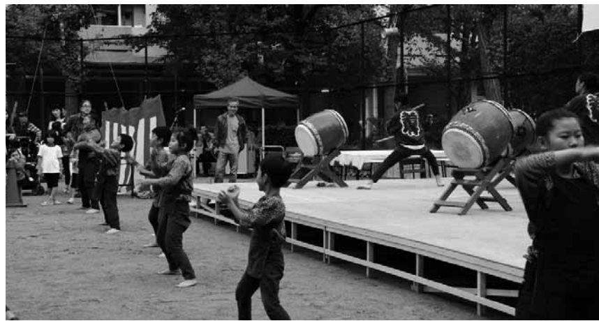
40周年記念まつりでの若竹太鼓の演技

6月25日 七夕飾りつけ行う。 7月26日 東京東管理センターとの懇談会実施。 8月23日 10月からの家賃値上げ反対地元選出議員への要請を行う。 9月18日 大島地区区民まつりパレード・こども広場開催。 9月25日 総合防災訓練開催。今年は大震災を想定した訓練で参加者全員が体験できた。約400名参加。 9月12日 第9回団地の生活と住まいアンケート実施。1181世帯集約。 10月1日 東京東管理センターとの通報訓練実施。 10月22日 大島六丁目団地40周年記念まつり開催。舞台、模擬店、ミニ列車、射的、フリーマーケット、宮城県物産店他。途中雨が降ったが、盛大に行われた。 12月 40周年記念お買い物券(2000円)発行。