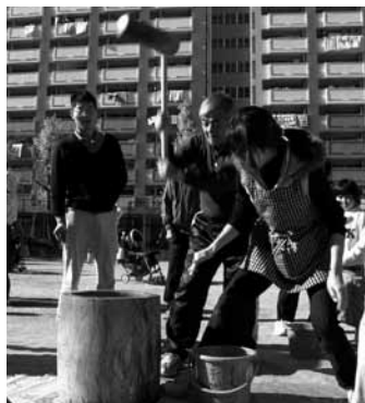
もちつき大会 みんなの会報227号掲載 (2008年1月22日発行)

11月9日 防災訓練開催。 12月4日 全国居住者決起集会に16名が参加。 1月18日 自治会新年会開催。 2月 3号棟で火災が発生。自治会として集会所を開放したり対応する。 3月29日 伊豆へのバスツアー2台で行う。観光と買い物を楽しんだ。 3月30日 ゴミの出し方が変更にな