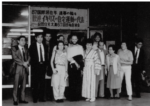
1987年10月イギリスの住宅運動家代表9人来訪

演の集いを3号棟集会所で開催。 10月19日 イギリスの住宅運動家代表9人来訪。自治会代表と住宅問題について話し合いの後、住居内を視察。 11月1日 第15回さわやか運動会開催。10月25日予定を雨天のため延ばされ、午前9時、若竹大鼓に始まり、各棟競走では3号棟が大繩とびで37回の記録をつ