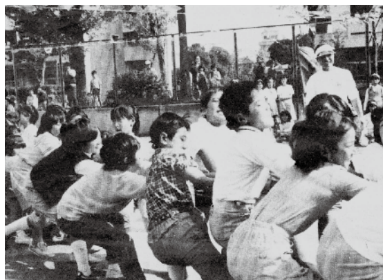
さわやか運動会・みんなの会報87号掲載 (1984年11月5日発行)

が良かった様でした。 12月16日 自治会恒例の「もちつき大会」が行われる。役員多数の他、お父さん方の参加も盛況に終了。 12月23〜30日 歳末パトロール、今年も例年通り実施。 3月 家賃裁判について、全国自治協と住宅・都市整備公団は木部建設大臣の斡旋を受諾し「和解申し立書」を八地方裁判所に提出、これにより家賃部会で話し合いを進める事となる。