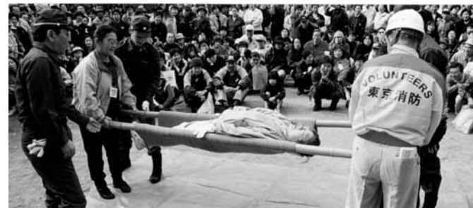
総合防災訓練・みんなの会報176号掲載(1999年12月1日発行)