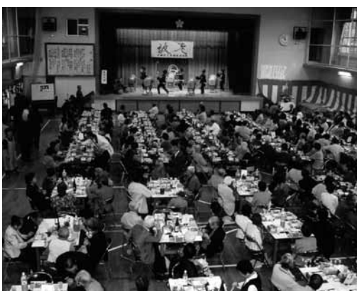
敬老のつどい・みんなの会報214号掲載 (2005年12月5日発行)