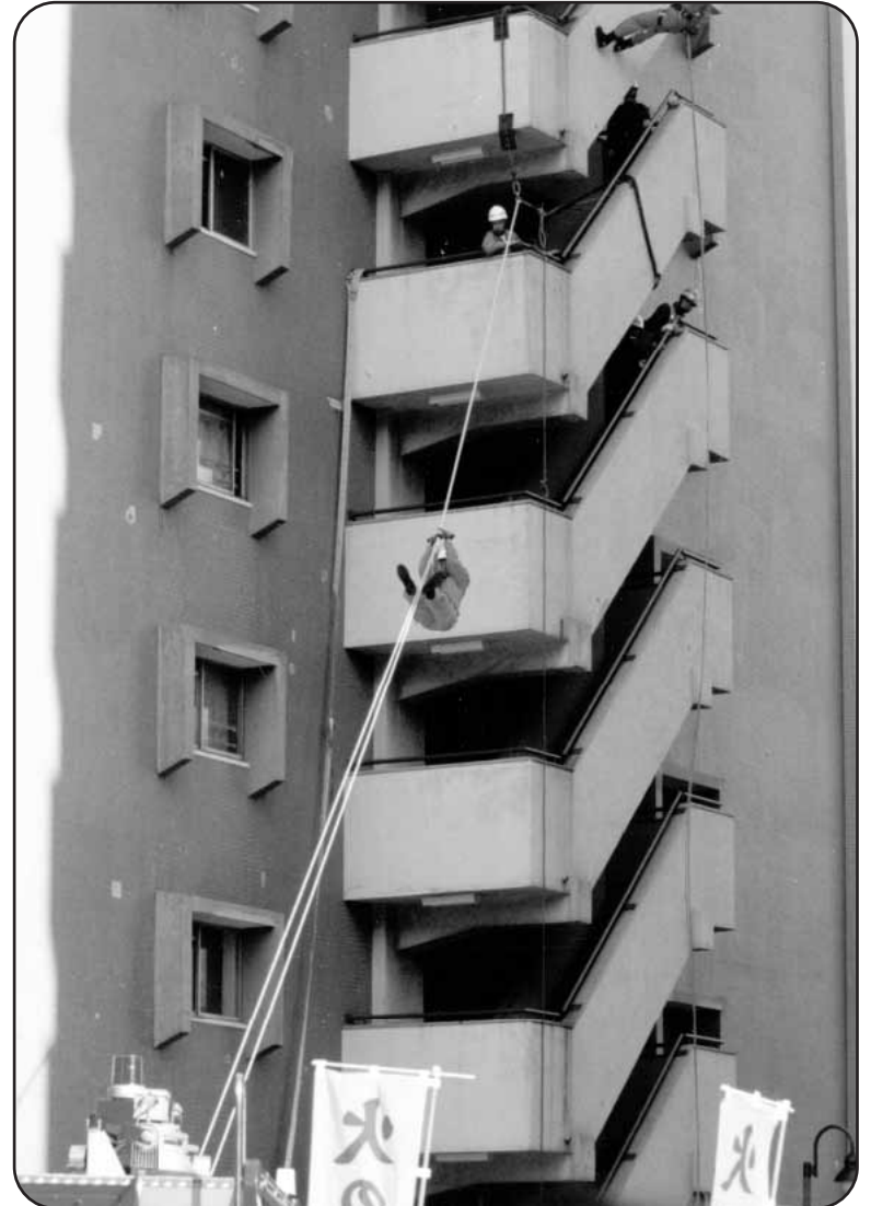
写真は、2000年度防災訓練での救助訓練

はしご車やポンプ車も参加して、4号棟9階より逃げ遅れた居住者の救出訓練等を見学します。