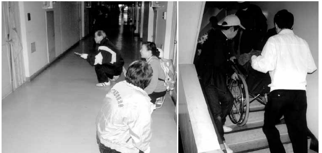
写真は、昨年度5号棟屋内で行なわれてた発災時対応訓練