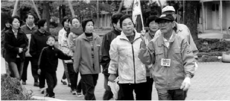
昨年度の避難誘導訓練