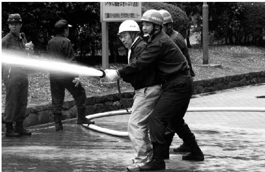
写真は、昨年度の消防団による放水訓練