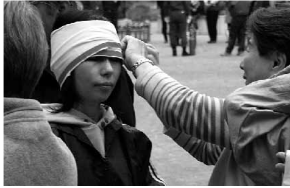
三角巾応急処置訓練

防災訓練の参加記念品として、今年度は「三角巾」を参加者1人に1本ずつお持ち帰り頂くことになりました。