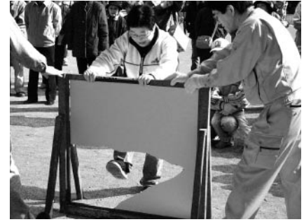
ベランダ境界壁破壊訓練