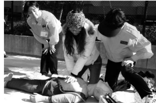
昨年度の心肺蘇生措置訓練