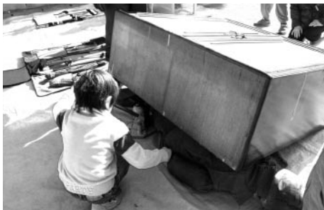
昨年度の家具下敷きダミー人形救出訓練

下記の救出訓練を交代で行います。 (1) 転倒家具を持ち上げ、ダミー人形を救出する。 (2) 担架（毛布と竹棒）を作り、ダミー（砂袋）を乗せ移送する。