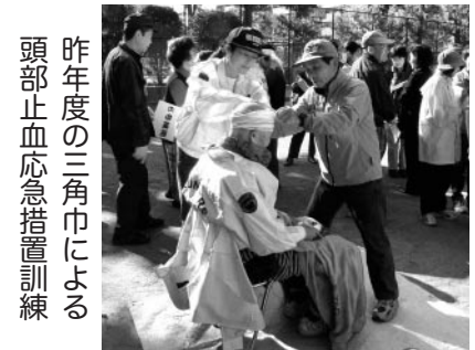
昨年度の三角巾による頭部止血応急措置訓練