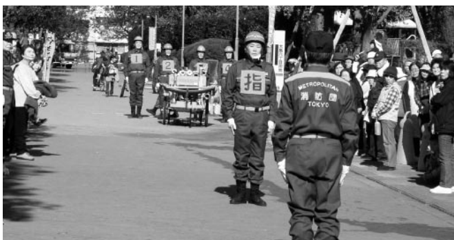
写真は、昨年度の消防団による放水訓練