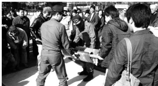
昨年度の毛布と竹竿の担架作りと移送訓練