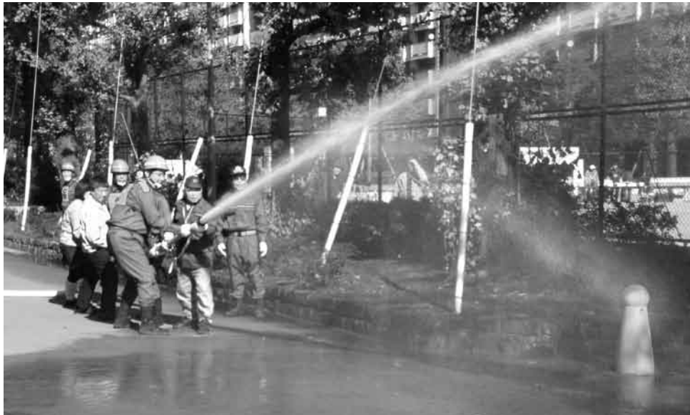
写真は昨年度放水訓練の様子