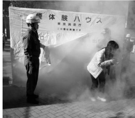
昨年度の煙体験訓練

下記の体験を交代で行います。 (1) 煙中の体験をする。（煙ハウス） (2) ベランダ境界壁の破壊・避難訓練をする。 (3) 頭部止血の応急措置を行なう。