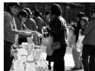
写真は、昨年度の炊き出し配給の様子