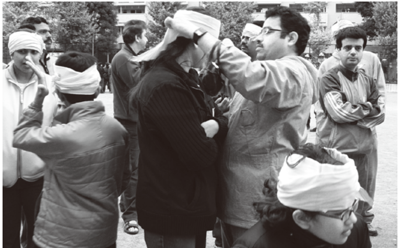
写真は昨年度三角巾の応急措置訓練の様子