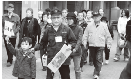
昨年度の避難誘導訓練

(2) 地区長、副地区長及び班長が協力して参加者の名簿を作成します。参加者は参加証のリボンを受け取ります。