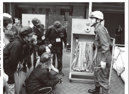
屋内消火栓の説明

11月9日、6丁目団地の防災訓練が雨まじりの天候の中、行われました。城東消防署、江東病院、J.S、東京防災救急協会、消防団の協力のもと、約300人が参加しました。5号棟での共助訓練を初め、避難誘導訓練、初期消火訓練、心肺蘇生AED、三角巾の応急措置訓練、煙中