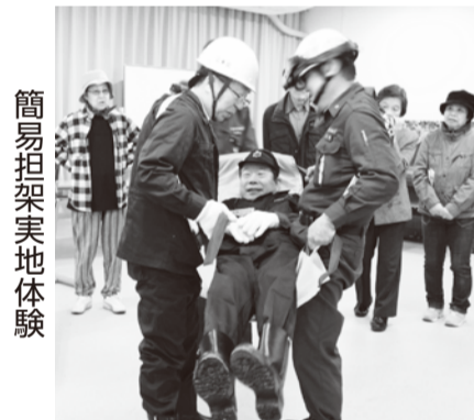
簡易担架実地体験