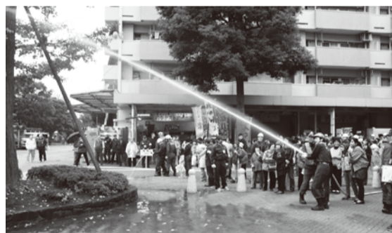
スタンドパイプ放水訓練