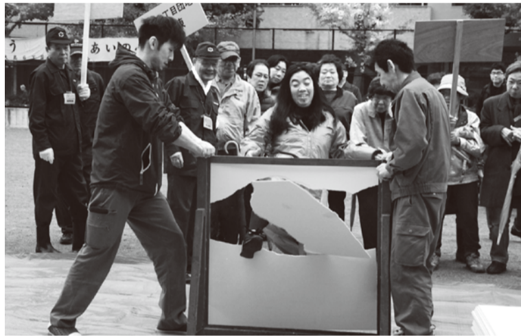
ベランダ境界壁破壊避難訓練