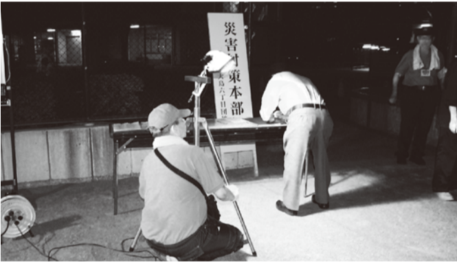
昨年8月の夜間防災訓練

阪神・淡路大震災の際、神戸市長田町では町会に住民がよく集まって、協力して火災を防ぎ、救急・救命を進めたことが教訓になっています。団地の自治会にも、役員やフロア連絡員、いざと言うときのた 災害協力隊の協力者などの安心・安全ネットワークがあります。団地自治会をつうじて、近隣の町会や学校、消防団、病院、そしてURや江東区とも連絡がとれています。自治会全員加入を呼びかけています。