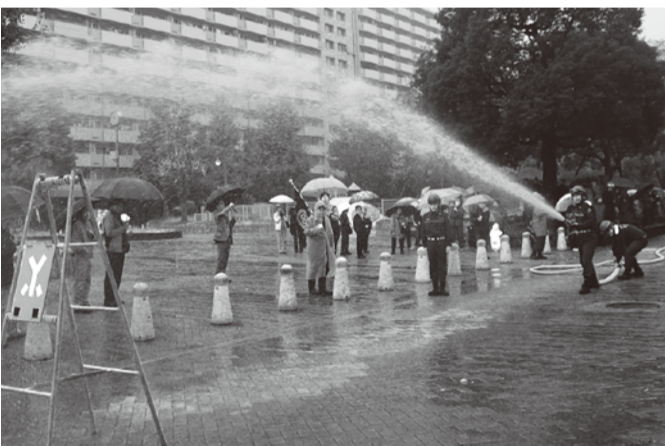
昨年11月の総合防災訓練