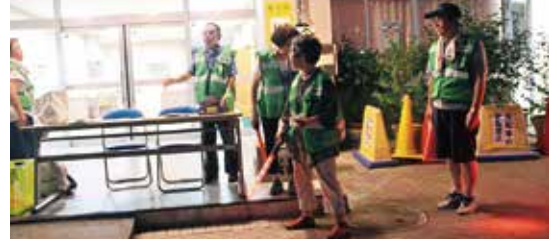
夏の夜間パトロール、二大中の父母の皆さん、団地の役員、大島3丁目団地、6丁目都営アパートの方々の協力で行いました。