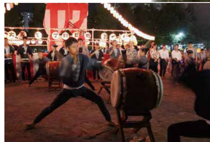
若竹太鼓・まつりのフィナーレに太鼓の音が響きわたる!

I came to know about the various activities conducted by Jichikai in this Danchi. Besides festivals like Christmas, Koinobori (Children's day celebrations), Cleaning Day, Danchi festival, Jichikai also conducts general meetings and floor meetings to know more about the views, problems, and practical solutions and tries to resolve them. I wish to have more interactions with people, know each other more and have a safe and comfortable stay in this Danchi. You are always welcome to join Jichikai and help make our danchi a safe and comfortable place to stay.