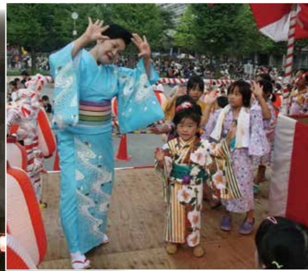
盆踊り・教わりながら楽しく踊る子どもたち。やぐらを囲んで、輪になって踊りました。