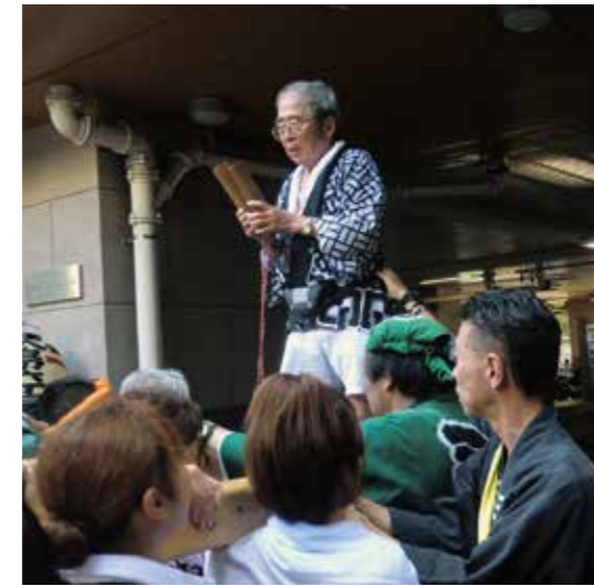
大人神輿・まつりを盛り上げる神輿と担ぎ手たち。老いも若きも男も女もインディアの方々もかっきました。