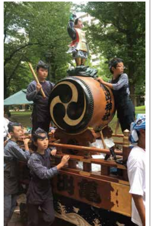
子ども山車と神輿・太鼓で出発の合図。たくさんのお子様たちでにぎわいました。夜店・80の出店で大にぎわいでした。