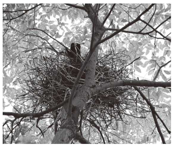
カラスの巣が2号棟前の楠にできました。6月2日には撤去されました。

広場の工事は6月から始まっています。地下排水工事・広場整備の工事がされます。団地周りの樹木の伐採は7月から始まります。現在樹木のところにテープが巻いてあります。