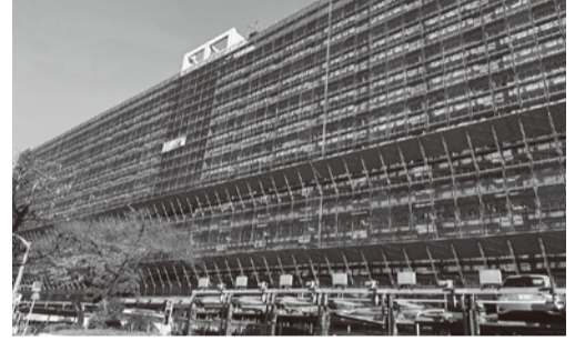
大規模修繕中の様子

○工事の後、ペランダの排水が悪い。URの手配した業者が来たけれど、これは治らないといわれた。(帯で流してくださいと言われた) ○ペランダの工事の際、シートを張ったところに黒いテープが張ってあるところがある。なんでだろうか。(段差の違いだと工事関係者の説明)