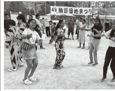
団地まつりでインドの皆さんが活躍