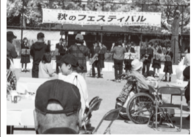
秋のフェスティバルでフリーマーケットが復活

自治会より★ [2] ごみ置場は奥の箱から入れてください。 ごまは、ゴミ置き場の奥の「箱」から入れてください。 ちゃんと入れると外にはみ出さなくなっています。生ごみをあさるガラスの被害もなくなります。