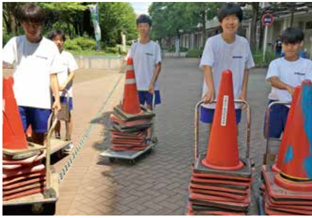
二大中学生のボランティアの皆さん