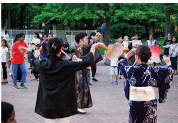
中央広場で盆踊りの練習をしました