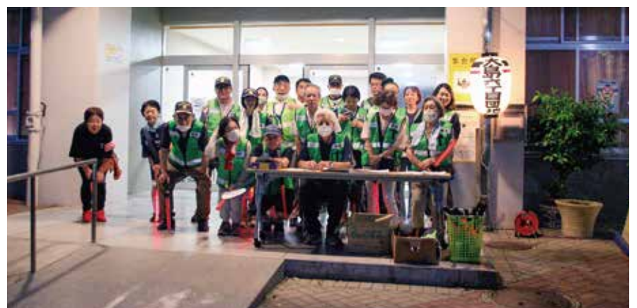
夏季夜間パトロールを、二大P.T.Aと自治会役員、大島3丁目団地、大島都営アパートの方々の協力で行いました。

Autumn Festivals 10月13日(日)、秋のフェスティバルが、午前11時から午後2時まで、中央広場を中心に行われます。