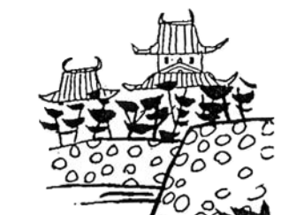
1657・江戸城天守閣が炎上

ろくだんの野の花 シロヤマブキ (バラ科) ヤマブキの白花ではなく、属が違う別種の落葉低木。その証拠に、ヤマブキの花弁が5弁なのに、こちらは4弁。葉もヤマブキでは互生、こちらは対生。実もヤマブキは5個、こちらは4個で、漆黒に光る実(12月下旬)は美しいものです。 花は直径4センチくらい4~5月に、やや濃い緑の葉の上に白い花、黄色い花粉のコントラストが映えて、清しさが目立ちます。 「桃栗3年、柿8年」と言いますが、この種も8年経たないと開花して実を結ばないと言います。変わり者仲間です。ろくだんの出生は定かではありませんが、鳥、もしくは植栽木の根に付いて来たのでしょうか?。20数年も前から見かけています。場所は3号棟東側歩道沿植樹(四大小入口付近)です。5月下旬には花期が終わりますが、来春4月の花にぞ期待下さい。 なお、ヤマブキの白花種は、シロバナヤマブキと呼びます。(06.4.19 写真と文・倉又頼夫)