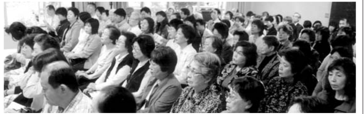
代議員の皆さんの真剣な眼差し

5月28日、大島六丁目団地自治会の第35回定期総会が、午前10時から、3号棟集会所で開催されました。昨日来の雨が続き、出足が心配されましたが、昨年を上回る代議員128人が出席されました。