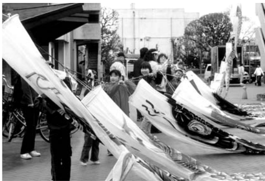
よい子たちもお手伝い