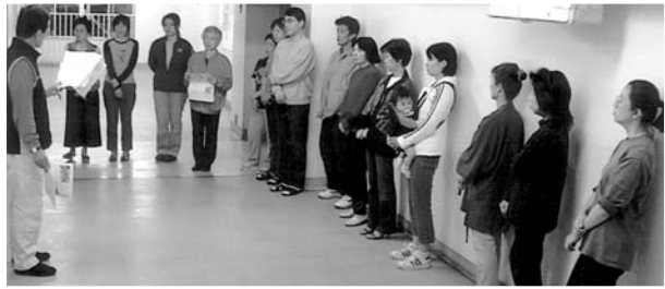
6号棟南のフロア会議

◎上階の騒音はどこまで我慢すればいいのか教えてほしい。管理事務所に相談したら個人で解決しろといわれた。管理事務所の女性の対応には誠意がない。 ◎外国人の住民に、騒音を注意しに行っても日本語が分からないとほけられる。洗濯物も下の方にまで下げて干すのでひらひらと目障りでしかたがない。 ◎深夜に、二大中前に若者が車で来てたむろして騒んでいることがある。警察にパトロールしてもらいたい。