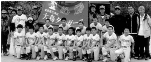
ナインの雄姿と監督、コーチ陣

私達団地の少年野球クラブ「大島タイガース」の子ども達が、5月の江東大会(江東区内51チーム出場)において、準優勝の成績を収め、全国大会の地区予選「東京都大会」の出場権を勝ち取りました。