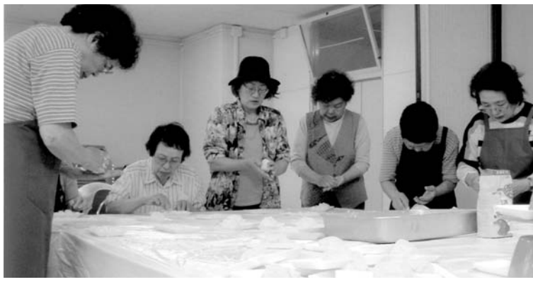
玉ねぎに涙しながら? 団子作り