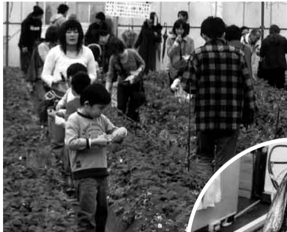
大きく甘いイチゴに満足