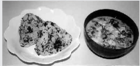
菜ア菜ご飯のお握りと酒粕汁