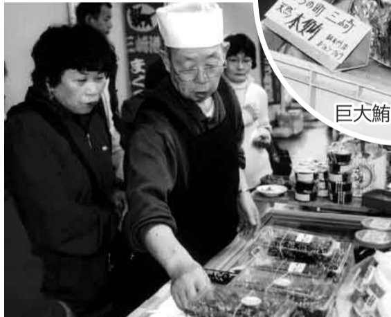
おすすめ上手にウツトリ