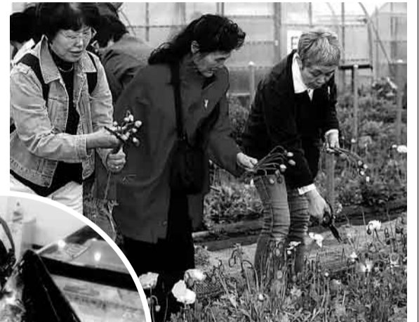
乙女ごころで花摘み