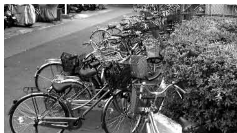
どこにでも、不規則な駐輪

放置自転車の撤去がまだ始まりませんでした。今回は2号棟だけで行っております。今後、江東病院の建替もありますが、ここ2号棟は都営新宿線の「大島駅」に一番近く、松坂屋ストアも目の前にあり、とても便利なエリアです。だからといって自転車を2号棟付近に簡単に気軽に止める事には合点がいきません。 (今後新しく自転車を購入される方や、希望者には「機構のマーク