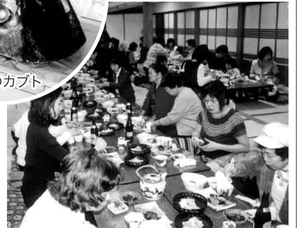
マグロづくし御膳でしたつづみ