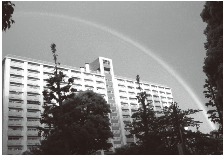
虹のかけはし

「みんなの会報」生活・環境部 当団地特製の、ごきぶり団子づくりを、6月6日午前10時より3号棟集会所で行い、25名が参加。良い環境づくりの一環で、玉ねぎに涙を流しながらも、なごやかに作業に取り組んでいました。参加者は「材料も個人