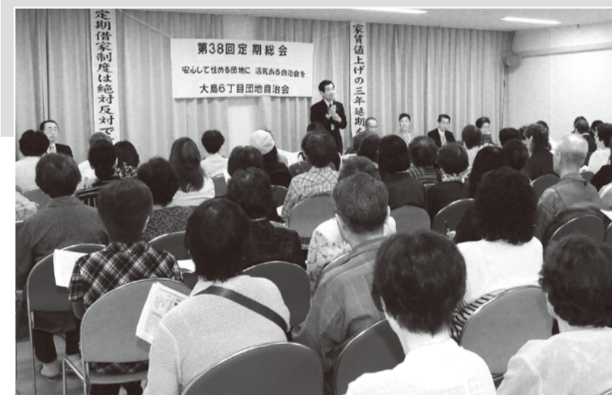
総会の様子(3号棟集会所)

六丁目団地の居住者のみなさまへ 新しく六丁目団地に住まれたみなさまへ 安心して住み続けるために、自治会への加入を心からよびかけます。 私たちの住む大島六丁目団地は、交通至便で、安心して安全な団地として人気があります。それだけに、3年ごとに最高額の家賃値上げが行われ、その結果、泣く泣く団地を離れた方も少なくありません。 リニューアル住戸に新規入居される方は、12万円をこえる高家賃となっています。くわえていま、URは5年契約の「定期借家契約制度」を導入しようとしています。 六丁目団地が、これ以上の高家賃・5年契約団地に変えられていけば、住み続けることができなくなりそうです。 自治会は3年ごとの家賃値上げをストップさせ、負担能力に応じた家賃制度に変えるために運動をしています。また「定期借家契約制度」に反対していきます。 自治会はまた、修繕や団地環境の整備、あるいは居住者の交流のために、隣近所のお付き合いも大切にします。 現在、7割の世帯の方が会費を納入していますが、近年、引越される会員が増えています。 みなさん、自治会に加わって、力をあわせていっしょに住み続けましょう。